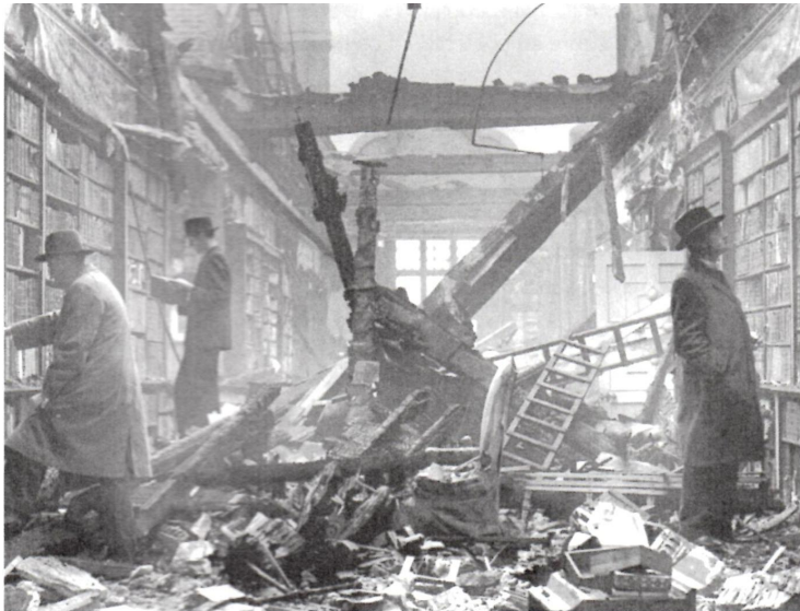
Biblioteca Holland House Kensington Londres 1940