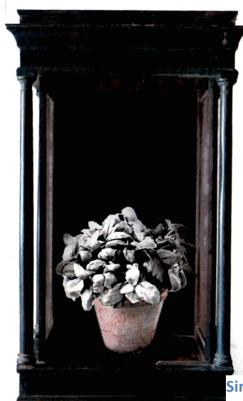
Simulació amb photoshop

És un projecte d'investigació i creació artística que es basa en la novel·la cinquena de la quarta jornada del Decamerón de Boccaccio . Tura proposa presentar un projecte que constarà, per una part, d'un petit estudi de la història, la de Boccaccio i les altres interpretacions d'aquesta mateixa, com ara el poema de Jhon Keats Isobella and the pot of basil , o la pel·lícula de Passolini Il Decamerón . I per un altre, la més important, és la realització d'una instal·lació escultòrica. El projecte es realitzaria a cavall entre Barcelona i Ordís (Alt Empordà).